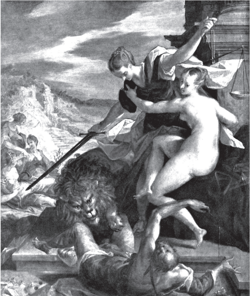
Hans von Aachen: Sieg der Wahrheit unter dem Schutze der Gerechtigkeit. 1598, München, Alte Pinakothek.

ist durch die ausgesprochene Wahrheit gewissermaßen geholfen, sie unterstützen und fördern sich in ihrem Wesen. Natürlich darf die Wahrheit nicht als eine Art Rammbock verwendet werden, der Schaden anrichtet. Es gibt Wahrheiten, für die wir noch nicht bereit sind, Wahrheiten, die uns überfordern, für die uns noch die Kraft fehlt, sie auszuhalten. Steiner weist des öfteren auf diese Tatsache hin. Das bedeutet aber nicht, daß die Menschen,