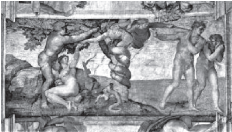
Michelangelo Buonarroti (1508/12) Uründe und Vertreibung Rom, Vatikan, Sixtinische Kapelle

Während der Erdentstehung haben die Schöpfergeister es ermöglicht, daß den Gegenmächten ein Freiraum eröffnet wurde, in dem sie an den